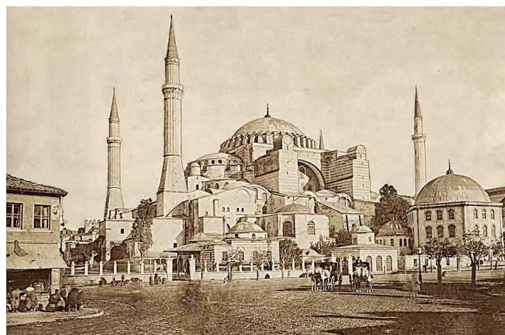
Η Αγία Σοφία στα τέλη του 19 ου αι., φωτογραφία εποχής

Πατριωτισμός, προσωπική φιλοδοξία, επιθυμία για την εύνοια του αυτοκράτορα, ελπίδα για προβίβαση, όλα αυτά, συνταίριασμένα με ειδωλολατρική σχεδόν δεισιδαιμονία και γνήσια ευσέβεια,