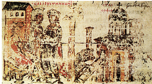
Η κατασκευή της Αγίας Σοφίας, μικρογραφία χφ. Σύνοψις χρονική Κωνσταντίνου Μανασσή (14 ου αι.)

σχεδόν μονομιάς. Η Αγία Σοφία ήταν «ταυτόχρονα προάγγελος και υπέρτατη έκφραση ενός νέου ρυθμού». Σε όλη την αυτοκρατορία στάλθηκαν προκηρύξεις για το έργο που είχε ξεκινήσει ο Ιουστινιανός και καλούσαν πιστούς και ευσεβείς να συνεισφέρουν.